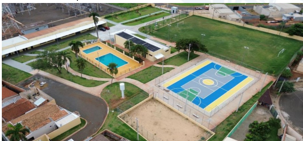
Vista área do Complexo

O Complexo Esportivo de Lazer oferecem diversas atividades físicas, como Hidroginástica, Musculação, Natação, Ballet, Judo, Muai Thai, Capoeira, Hit box, Futebol.